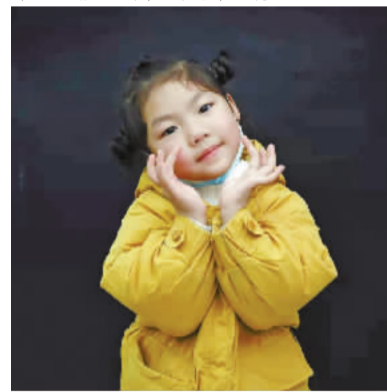
宁波市第六医院，一位小朋友手上伤治好后，摆好造型拍照留念。