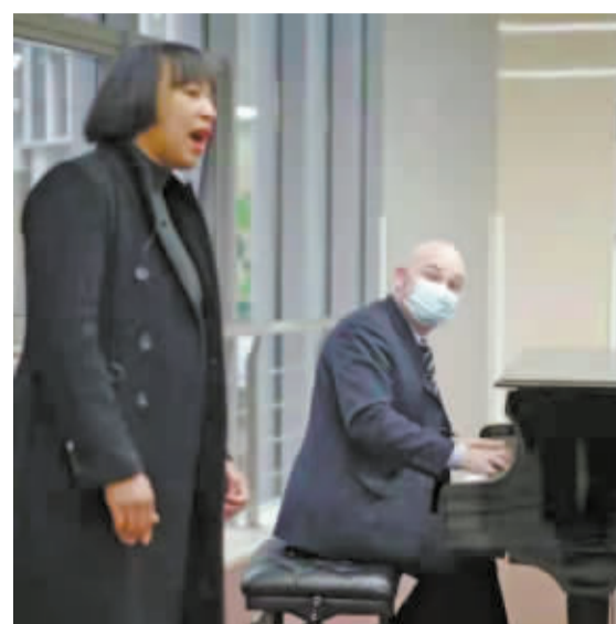
宁波市医疗中心李惠利医院东部院区，外籍夫妻在医院大厅献唱《茉莉花》。

新的一年，我们的《医院暖镜头》栏目还将继续步履不停，收集那些闪闪发光的感人瞬间，以温暖致医者，致你我，致未来。