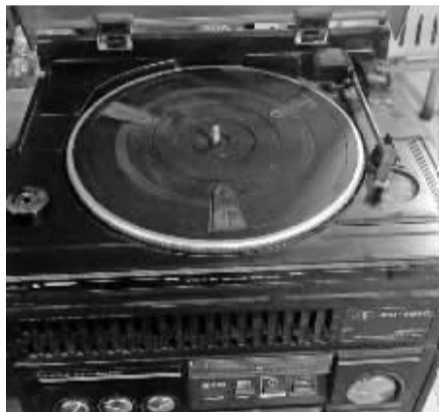
组合音响是当年有钱人的标配。

一谈起黑胶,不了解的人会说,嗞啦嗞啦的都是噪音,早过时了;喜欢的人会说,这是奢侈的音乐,我们玩不起。但我觉得,听黑胶相对其他生活爱好,既可以欣赏交流,又可以收藏把玩,是一个很实用的爱好。一定说它是奢侈的,主要是需要占用我们不少时间,但是这些投入的时间,却可以回报我们相当多的快乐。