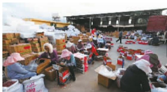
12月27日,接到一个来自宁波的大订单,当地农民正在把苹果装箱。