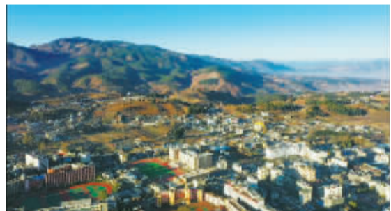
地处大山深处的盐源县。