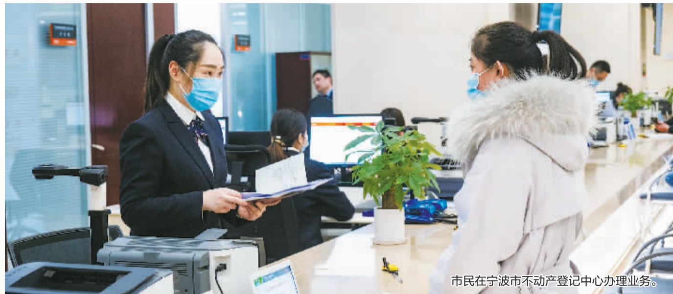
市民在宁波市不动产登记中心办理业务。

去年4月起，宁波市自然资源和规划局开展了“我为群众办实事、我为企业解难题、我为基层减负担”专题实践活动，着眼解决当前群众、企业和基层最关心、最现实的“急难愁盼”问题。为进一步提升服务能级、完善服务举措、强化服务实效，市自然资源和规划局创新实践“三为”专题实践活动，全力打造“为民服务”品牌。