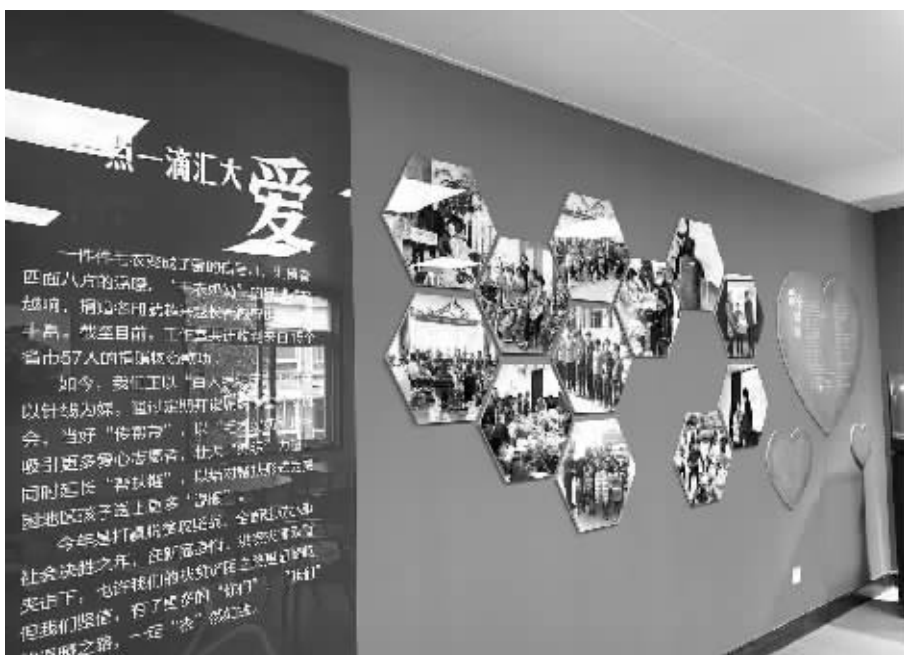
“毛衣奶奶”记忆馆开馆。

大家还记得温暖了全国网友的“毛衣奶奶”吗? 2021年6月,“毛衣奶奶”记忆馆启动建设,经过大半年的设计布置,昨天上午,记忆馆终于建成开馆。未来,更多的爱心将在这里汇聚,“毛衣奶奶”的大爱将不断延续。