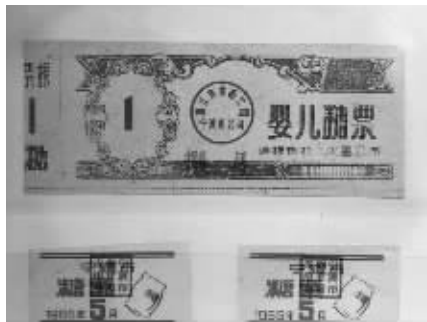
周健平捐赠的部分藏品。