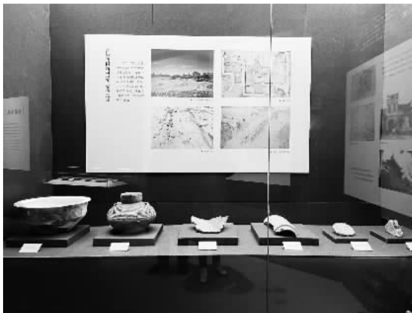
余姚花园新村汉六朝遗址出土文物。

“汉风姚城”展由宁波市文化广电旅游局（宁波市文物局）、余姚市申报国家历史文化名城工作领导小组主办，宁波市文化遗产管理研究院、余姚市文化和广电旅游体育局（余姚市文物局）承办，位于余姚博物馆二楼临展厅，将持续到4月20日。