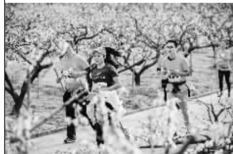
往届“桃花马”比赛场景。