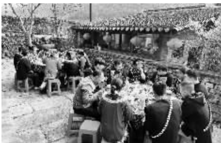
20余名彝族职工留甬过年。

本报讯(记者 林微微 通讯员 王飞) 1月18日,奉化区尚田街道冷西小栈民宿内,张灯结彩,年味十足,20名在奉化务工的凉山彝族自治州甘洛县职工与2500公里外的凉山州甘洛县的父老乡亲们连线,通过团圆饭直播的形式,“云”上共食团圆