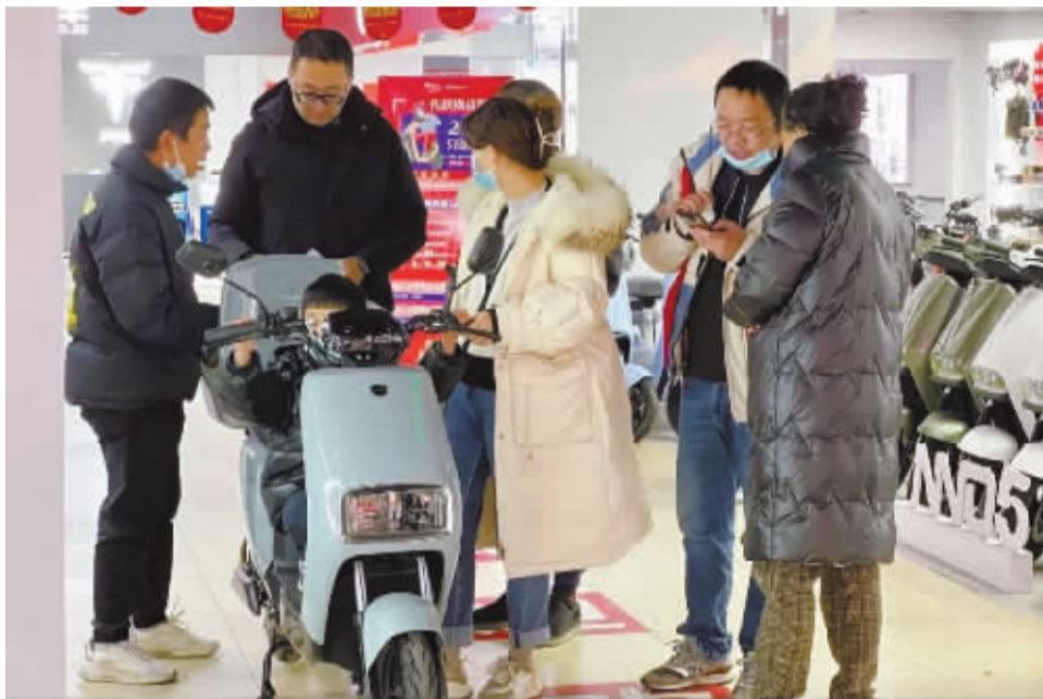
去年以来,电动车换购活动一直人气很旺。

根据《浙江省电动自行车管理条例》第十九条第一款有关规定,“备案非标电动自行车自备案之日起使用期满七年的,不得上道路行驶。使用期满七年的备案非标电动自行车自2023年1月1日起不得上道路行驶”。