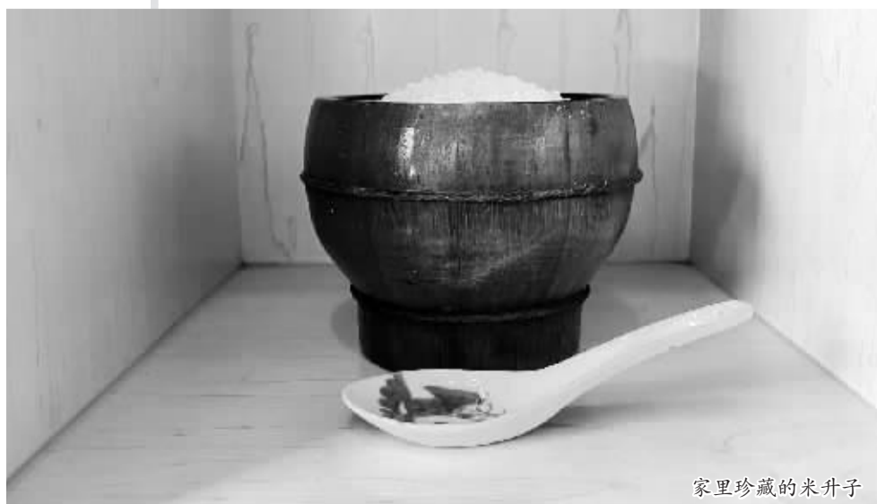
家里珍藏的米升子