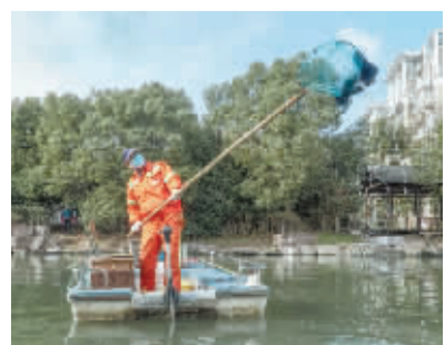
保洁员正在进行河道保洁。