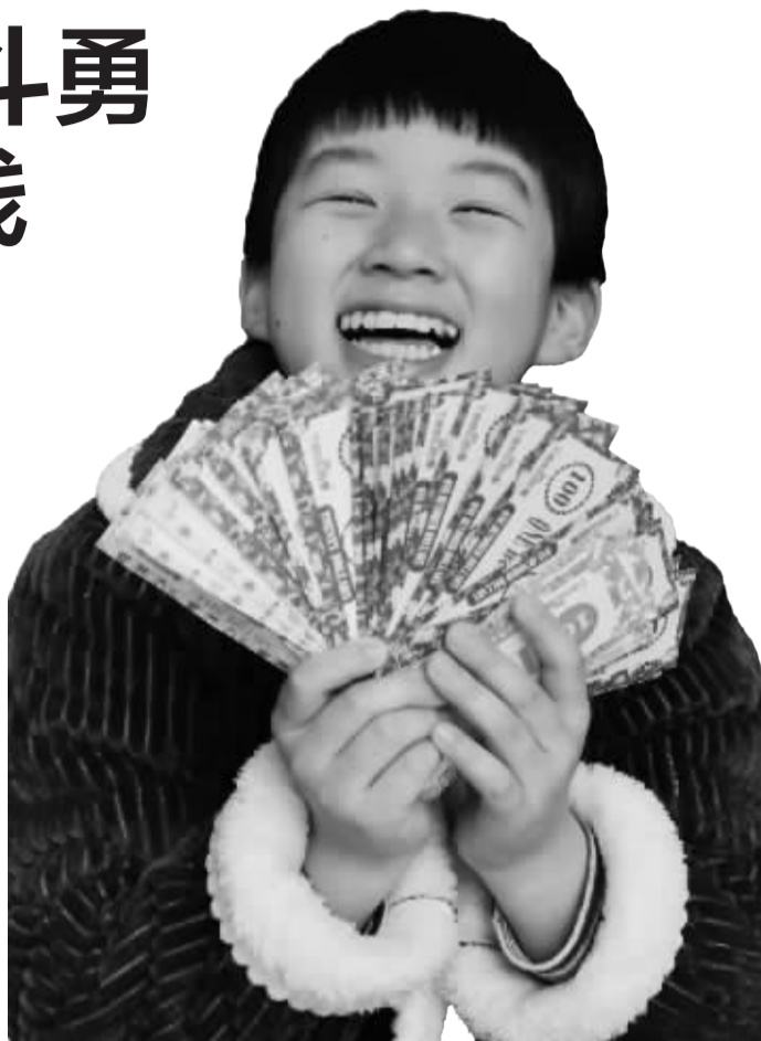
源源收到零花钱开心极了。

压岁钱谁保管?怎么花?每个小家庭都有自己的考虑。这两天,记者在宁波家长群做了个关于压岁钱的小调查,也采访了5户家庭,看看他们是怎么安排压岁钱的。