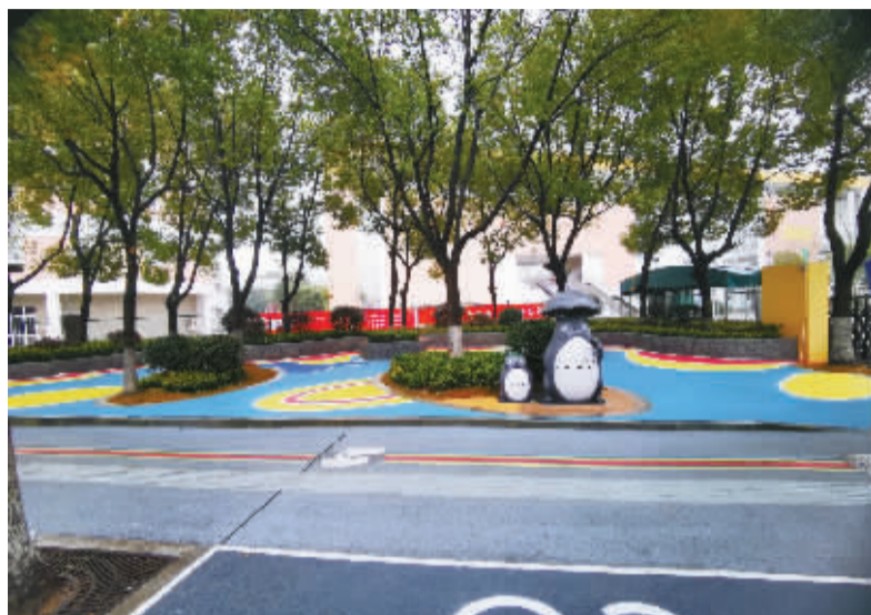
洪塘中心小学改造后