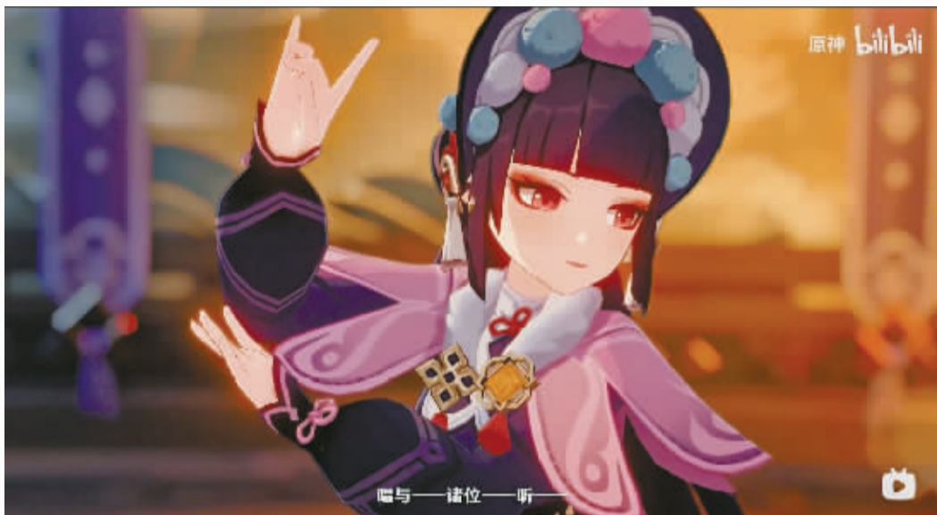
近日出圈的《神女劈观》截图。

难以忽视的是，中国传统文化中的戏曲正在突破不同圈层，破界、跨界、跨次元传播，迎来新的发展。走在“出圈”大道上的戏曲，在年轻人心里“种草”的同时，其实也是在“入圈”。