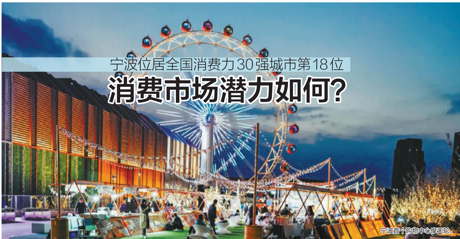
宁波首个购物中心摩天轮。