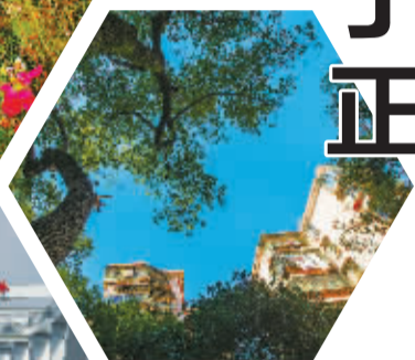
改造后的江北红梅小区