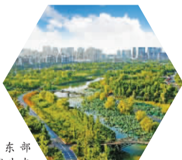
东部 新城生态 走廊绿道