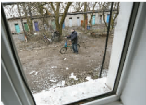
2月24日，顿涅茨克当地居民查看受损的房屋。新华社发

泽连斯基在此前的视频讲话中也曾呼吁俄罗斯就停止军事行动进行谈判。他说，不管怎么样，俄罗斯迟早都要与乌克兰进行谈判，讨论如何停止军事行动等问题。他还说，美国和其他国家一天前宣布的制裁措施不会让俄罗斯停止针对乌克兰的军事行动。泽连斯基说，乌克兰在独自作战，目前乌方已有137人死亡，另有316人受伤。