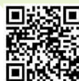
扫描二维码 可欣赏视频

自今年开始观察身边的鸟，好像又进入了一个全新的世界，眼中见到的耳中听到的鸟类越来越多了，原来我们身边有这么美丽可爱的精灵。它们和植物一起感知着物候的变化，用其活泼的独有天性，加入春天的集体舞蹈之中，为我们奉献一曲又一曲精彩动人的天地之歌。