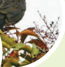
◀ 珠颈斑鸠在树上秀起了恩爱

来飞去，叽叽喳喳似乎在和梅姑娘说着告别的话语。两只珠颈斑鸠在树上秀起了恩爱。那只在岸边徘徊觅食的白鹭，换上了一身华丽的繁殖羽，正在为繁殖下一代积蓄能量。