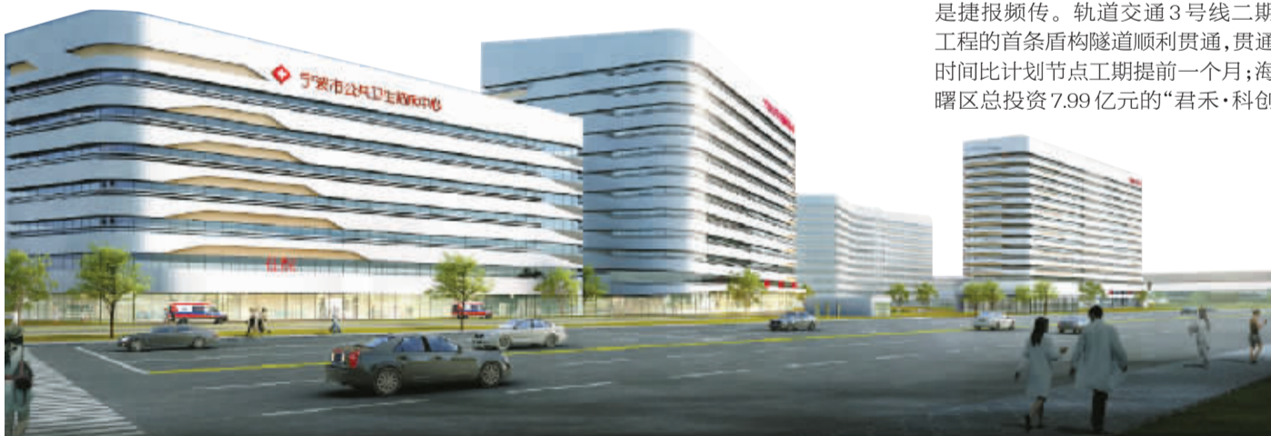
▼宁波市公共卫生临床中心效果图。