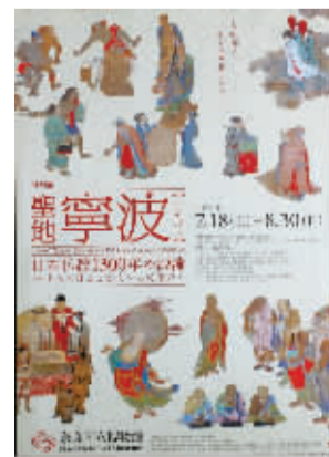
2009年奈良国立博物馆“圣地宁波”展海报 资料图片