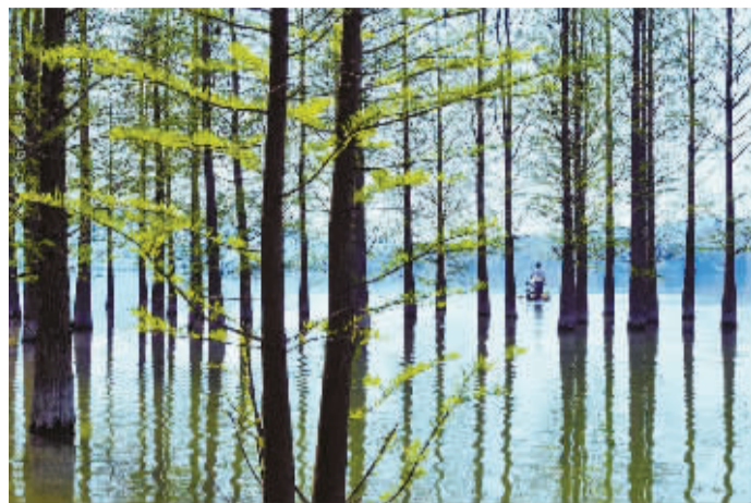
▲ 这是以秋色闻名的余姚四明湖，杉树红时，打卡的游客一拨又一拨，但安安静静的春天也很美。

浙江“万千工程”造就了万千美丽乡村，城乡融合、共富共美的理念深入人心。最近几年，摄影师易国庆跑遍宁波的一个个山野村庄，他镜头下的片片青绿，像明媚悠远的田园诗，让人心生向往，念念不忘。