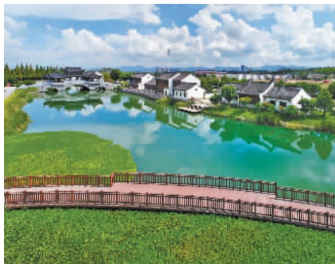
▲ 这是著名的奉化区滕头村，全国首个村域5A级景区，一本共同富裕的生动“教科书”。