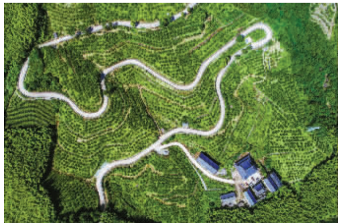
▲ 这是海曙区龙观乡中坡山森林公园，海曙开发的多条美丽经济走廊连起了景区、村庄、城镇，山山水水更有活力。