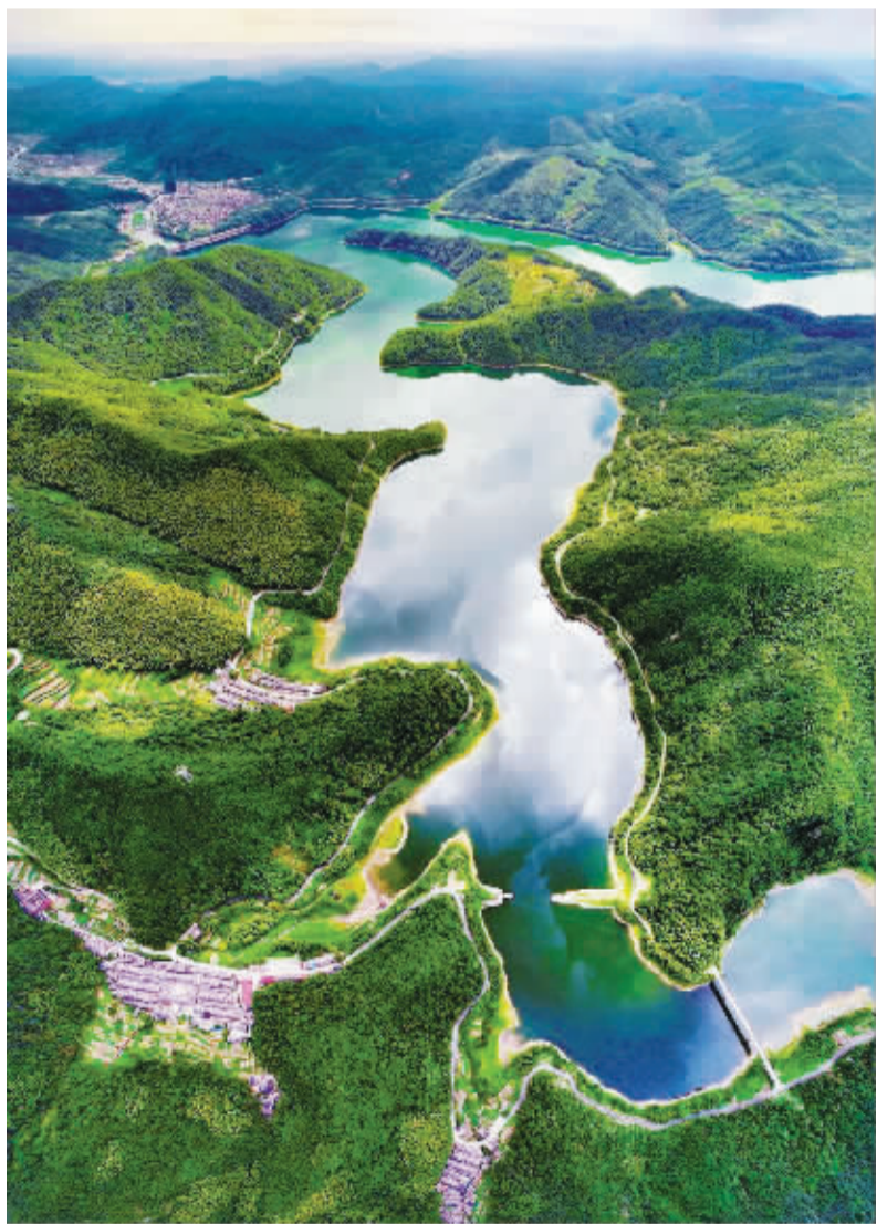
▲ 这是宁波的“生命之源”皎口水库，群山围绕，茂密的森林是水源保护强有力的绿色屏障。