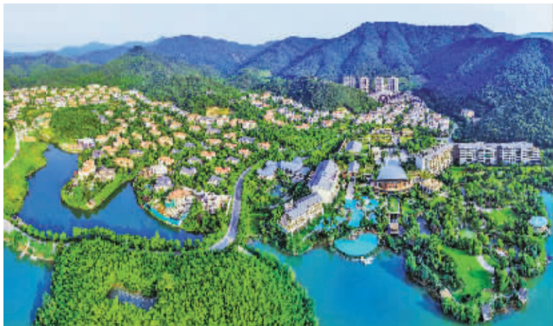
▲ 这是镇海九龙湖镇，在以“生活美学村”为目标进行规划开发后，“颜值”不断刷新，像个童话小镇。