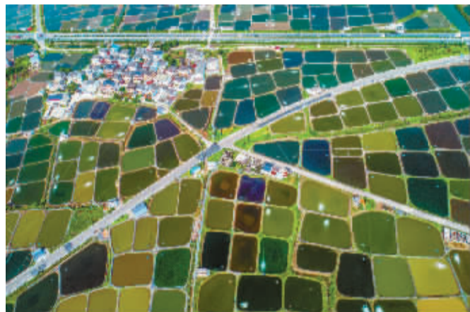
▲ 这是鄞州区咸祥镇的“眼影盘”，咸祥背靠象山港，拥有上万亩养殖塘，“眼影盘”就是“致富田”。