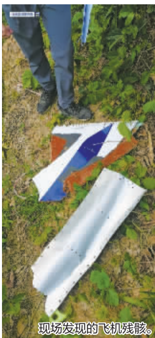
现场发现的飞机残骸。