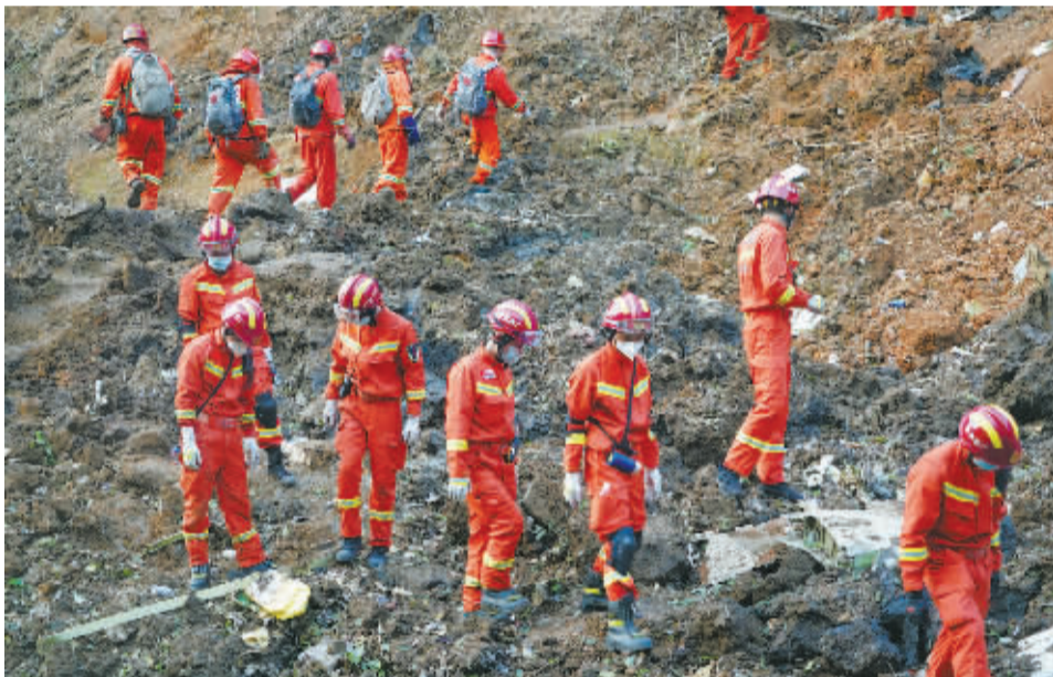
救援人员在现场搜救。

据悉,藤县隶属于广西壮族自治区梧州市,东接苍梧县、长洲区、龙圩区,南界岑溪市、玉林市容县,西邻贵港市平南县,北与蒙山县、昭平县毗邻。