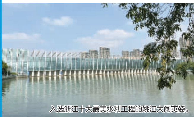
入选浙江十大最美水利工程的姚江大闸英姿。