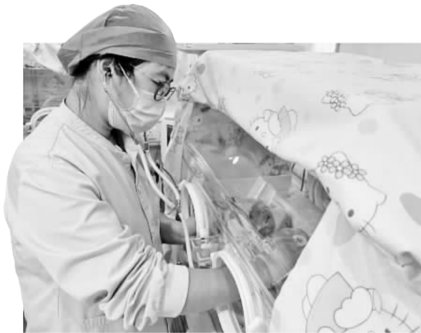
医生对患儿进行治疗。

雪菜蚕豆、茴香蚕豆、蚕豆焖饭……是不少宁波人的心头好，然而，有一个宝宝才出生3天，就被医生“宣判”一生不能体验吃蚕豆的快乐。