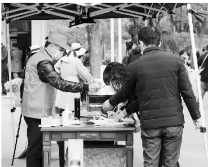
预约扫墓的市民需要实名登记、测温、亮“两码”才能进入。

天交警投入400余警力参与清明安保,鄞州五乡方向墓区周边交通流量稳定。截至上午9时,扫墓出行30064人次,其中地铁宝幢站出站10910人。