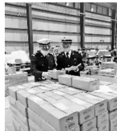
宁波海关关员正在查验中东欧进口包裹。