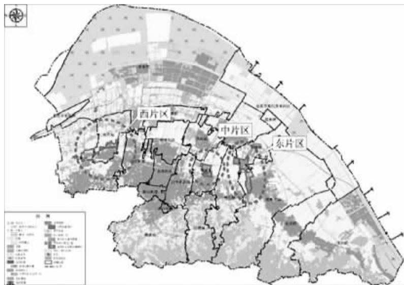
宁波慈溪智能家电高新技术产业园区区块图