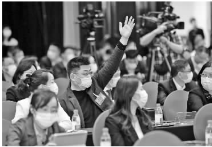
委员们踊跃发言。记者 张培坚 摄

4月10日,在宁波市政协十六届一次会议协商交流会上,委员们围绕“推进‘双减’背景下初中段教育高质量发展”主题,与市委宣传部、市委编办、市发改委、市教育局等10多个部门负责人进行协商交流。