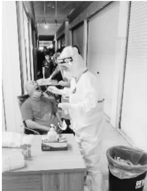
菜市场经营户接受每天一次的核酸检测。

“大家排好队，戴好口罩，亮码、测温才能进市场！”4月12日一大早，姜山菜场门口一位管理人员，举着话筒大声引导着前来买菜的群众。