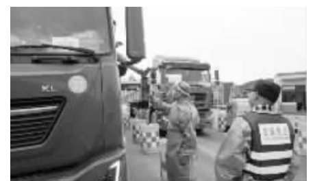
防疫人员为货车司机提供服务。

全省目前设有8对涉沪货车停靠指定服务区,如果行程涉及上海行程的司机,可就近选择,点击导航前往。还有全省11个设区市以及义乌市的交通运输保障电话,司机如果有问题可直接拨打咨询。