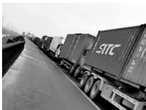
疫情期间,港口高速公路上集卡车排起长队。

货运物流是国民经济的“大动脉”。背靠全球集装箱吞吐量第三的宁波舟山港,每天有2万多辆集卡车在宁波行驶。这个庞大且四处流动的群体,成为当地疫情防控工作的重中之重。