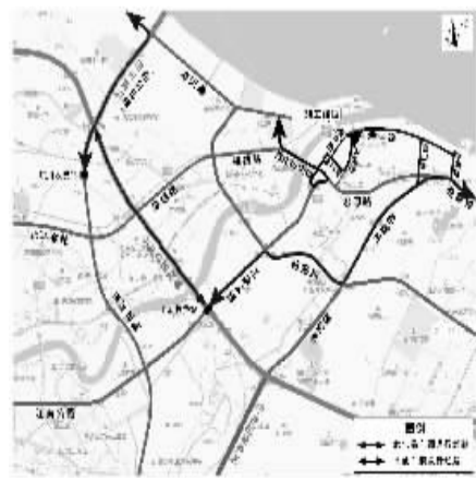
图1 车辆绕行线路示意图