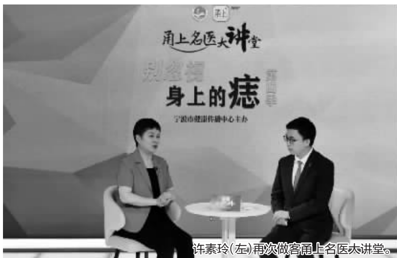
许素玲(左)再次做客甬上名医大讲堂。

脸上的痣要不要点？烫伤的部位发痒怎么办？……昨天上午，宁波大学医学院附属医院院长、皮肤科专家许素玲教授再次做客甬上名医大讲堂。直播中，许教授结合近期门诊，向大家科普哪些是危险的痣、要当心哪些痣可能是皮肤癌前病变。