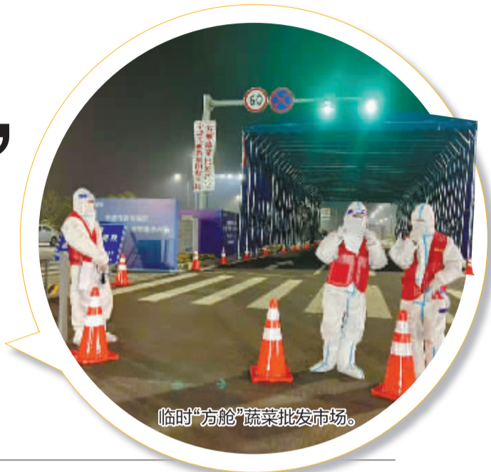
临时“方舱”蔬菜批发市场。