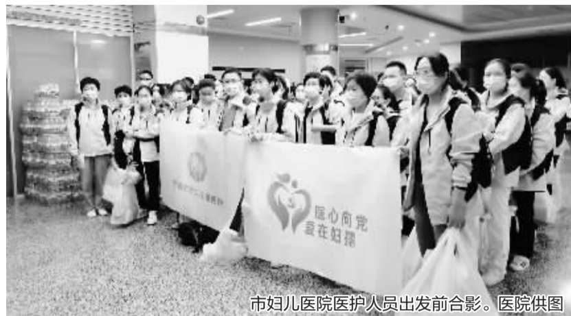
市妇儿医院医护人员出发前合影。

昨天早上6点开始,奉化区开展第二轮全员核酸检测,来自宁波各医疗机构的医护人员当天凌晨集结,前往支援进行核酸采样。有的医护人员在“五一”假期里已经连续作战多日,有的则是刚从上海核酸采样隔离回来,马上又开始新的采样任务。