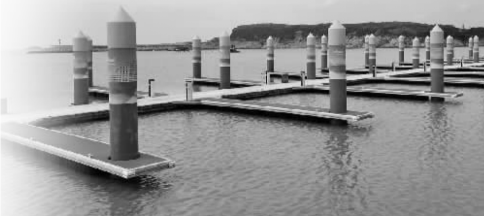
宁波象山亚帆中心场馆一角。