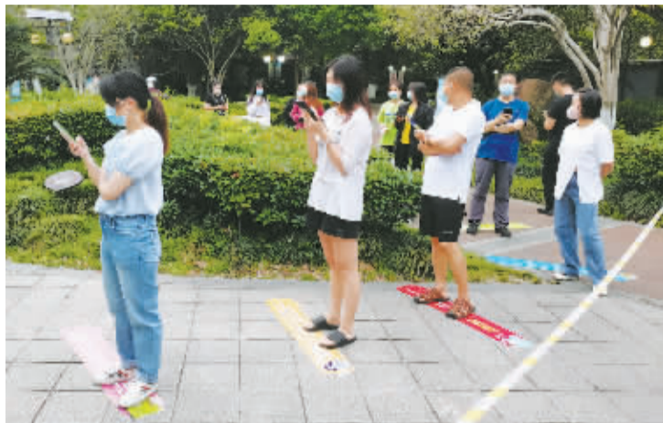
白鹤悦沁园采样点的“城市记忆版一米线”。

虫，听说它是跑得最快的昆虫！”刚做完核酸采样，夏鹏轶就心痒痒，想去参观附近的周尧昆虫博物馆。原来，周尧昆虫博物馆就位于社区附近，为了让核酸检测采样点的排队等候变得不再枯燥，社区推出了“昆虫科普一米线”。