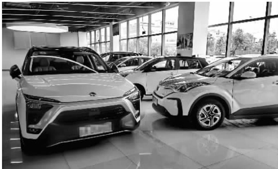
二手车商行开辟“新能源车专区”。

业内认为,新能源车保值率提升,一定程度上也反映出市场对于新能源车的认可度不断增加。