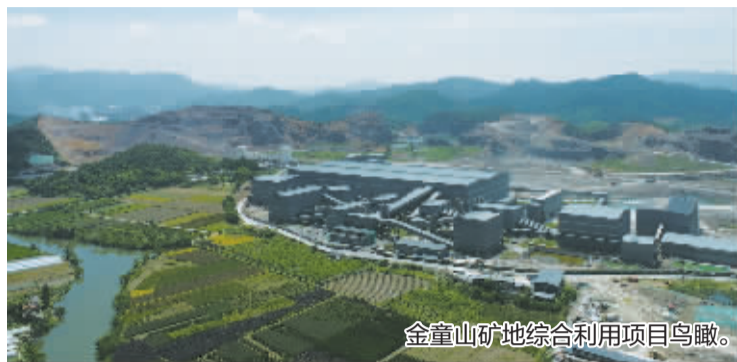
金童山矿地综合利用项目鸟瞰。

日前,宁波交投资源有限公司负责经营的思通矿业金童山矿,顺利通过市应急管理局组织的安全验收,成功取得由浙江省应急管理厅核发的安全生产许可证,这标志着金童山项目基建和安全生产系统建设全部完成,安全生产条件已经具备,正式从基建期转入生产期,可以全面开展矿石开采、加工、销售业务,矿山进入全面生产运营阶段。