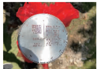
“环浙步道”东线起点零号标志柱上的二维码和相关信息。