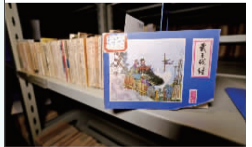
小人书承载着历史的记忆。