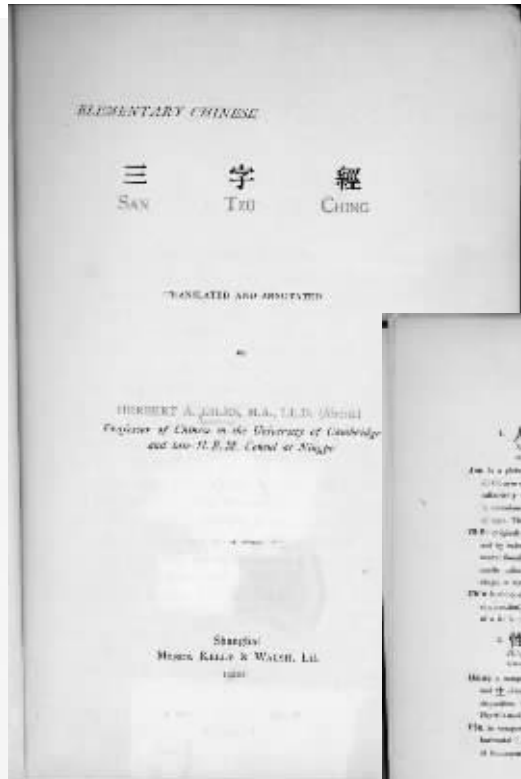
翟理斯译本《三字经》封面。

近日,由知名汉学家、前英国驻宁波领事翟理斯翻译的英文单行本《三字经》,在时隔一个多世纪后,回到了故乡宁波,目前该书已被宁波市档案馆征集。