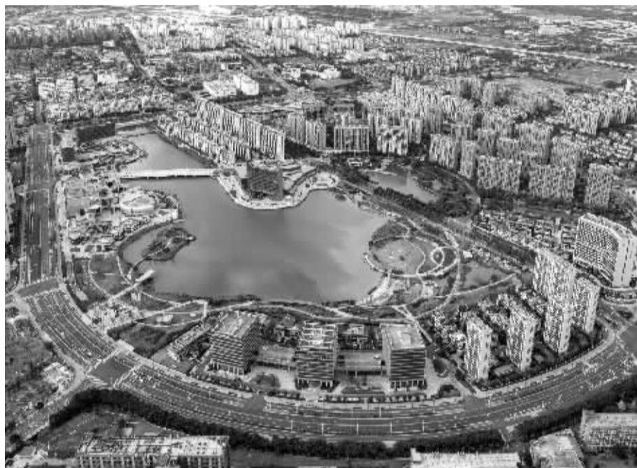
镇海湖滨未来社区。

那么,未来社区究竟有什么不一样之处?未来还会打造成什么样子?今后的未来社区创建,我市会朝哪个方向努力?记者通过采访社区、专业人士等,探寻其中的答案。