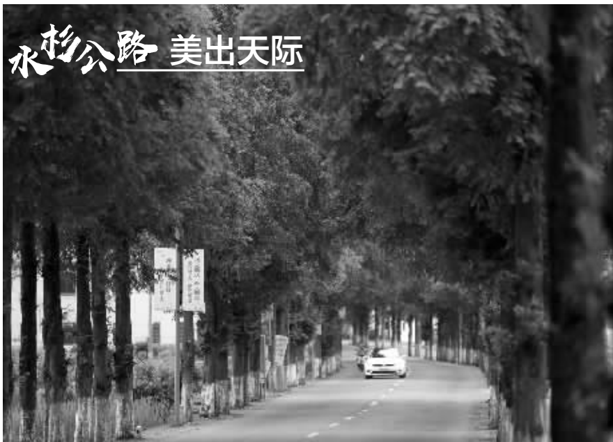
水杉公路 美出天际