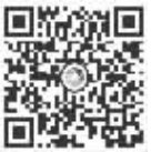
扫码了解更多内容