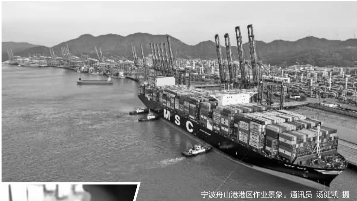
宁波舟山港区作业景象。通讯员 汤健凯 摄