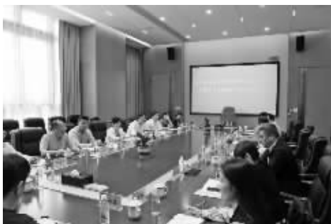
揭牌仪式暨工作座谈会。

5月25日,浙江省药品监督管理局与产业发展研究会宁波工作站揭牌仪式暨工作座谈会在美康生物科技有限公司召开。浙江省药品监督管理局一级巡视员、浙江省药品监督管理局与产业发展研究会会长陈智慧和宁波市市场监管局党委书记李国宏为研究会宁波工作站揭牌。