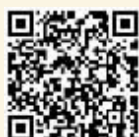
梦江南 艺术杂谈(上)