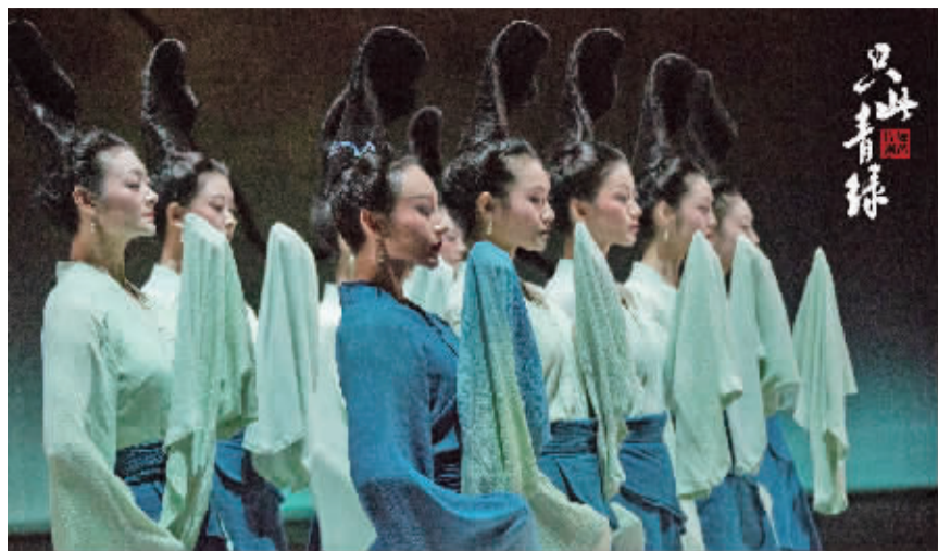
《只此青绿》剧照。