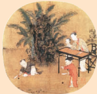
宋画《蕉荫击球图》中也有褙子形象。

虽然故事的主要发生在距离宁波千里之外的汴梁(今开封)，但该剧和宁波渊源颇深。其中的历史背景和剧情故事，很多与宁波息息相关，甚至还有典故和遗迹留存至今。