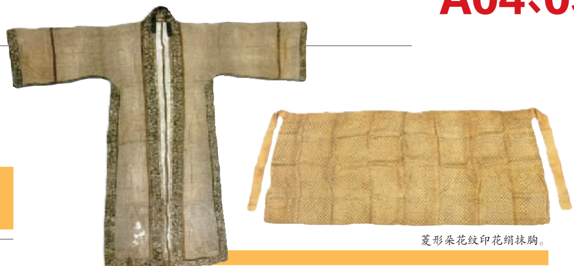
南宋黄昇墓出土的褙子。