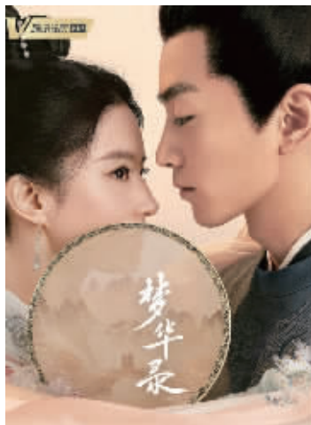
剧名中的「录」写错了吗？