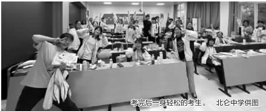
考完后一身轻松的考生。

本报讯(记者 李臻)昨日下午4:30,随着地理终考铃声响起,2022年浙江高考结束了!