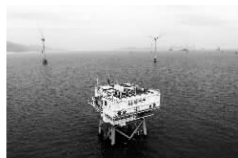
海上风机。