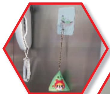
电梯里的温馨小挂件。