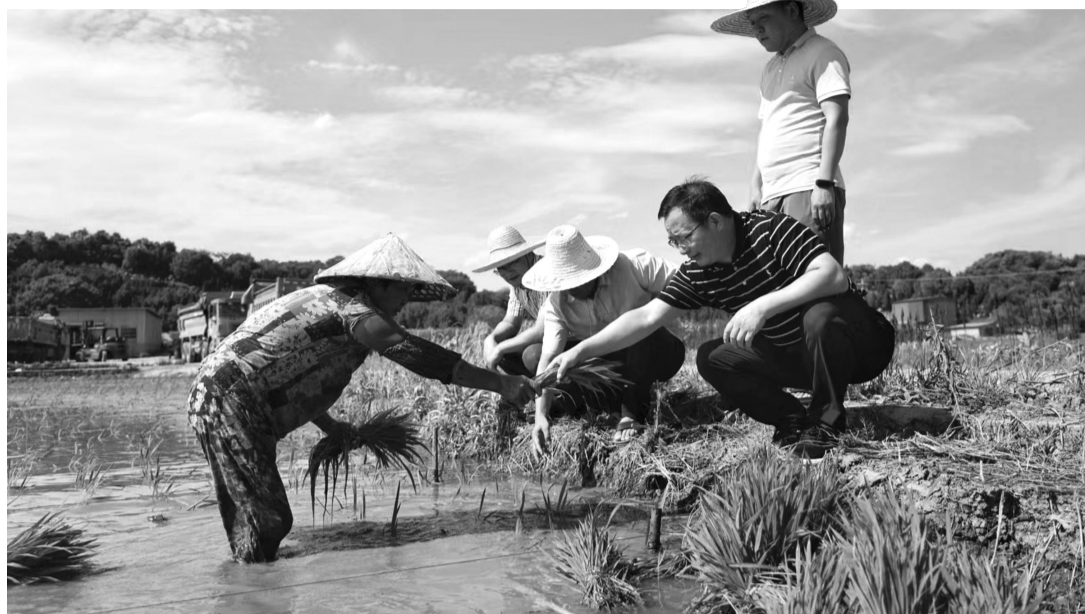
农技专家在田间地头指导种植户。