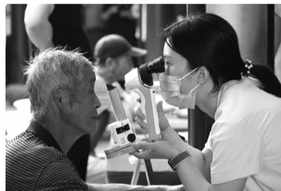
专家义诊。